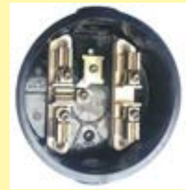
BP-5100 y BP-4100

Poste Octagonal y Troncocónico fabricados en Fibra de Vidrio 7 a 26 m de largo. Ligero y libre de mantenimiento. Vida útil 40 años.