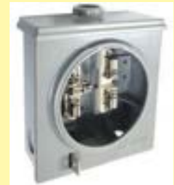
BRP-5100 y BRP-4100

Bases Poliméricas a Prueba de la Corrosión y Falsos Contactos, para Zonas de Alta Contaminación Salina e Industrial.