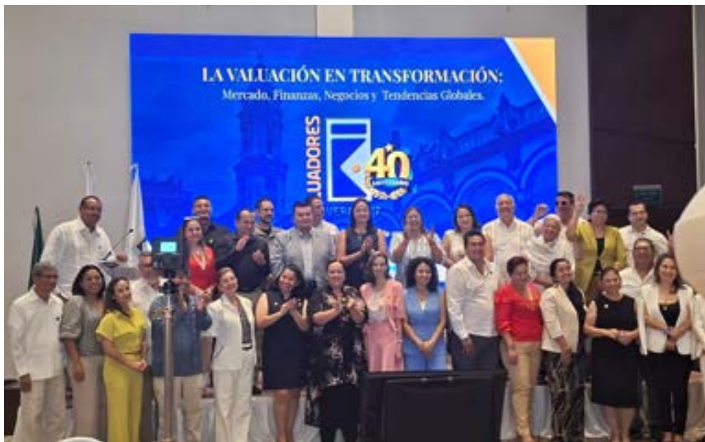
COMPROMISO VISIONARIO DE 4 DÉCADAS ES EL LEGADO DEL COLEGIO E INSTITUTO DE VALUADORES DEL ESTADO DE VERACRUZ