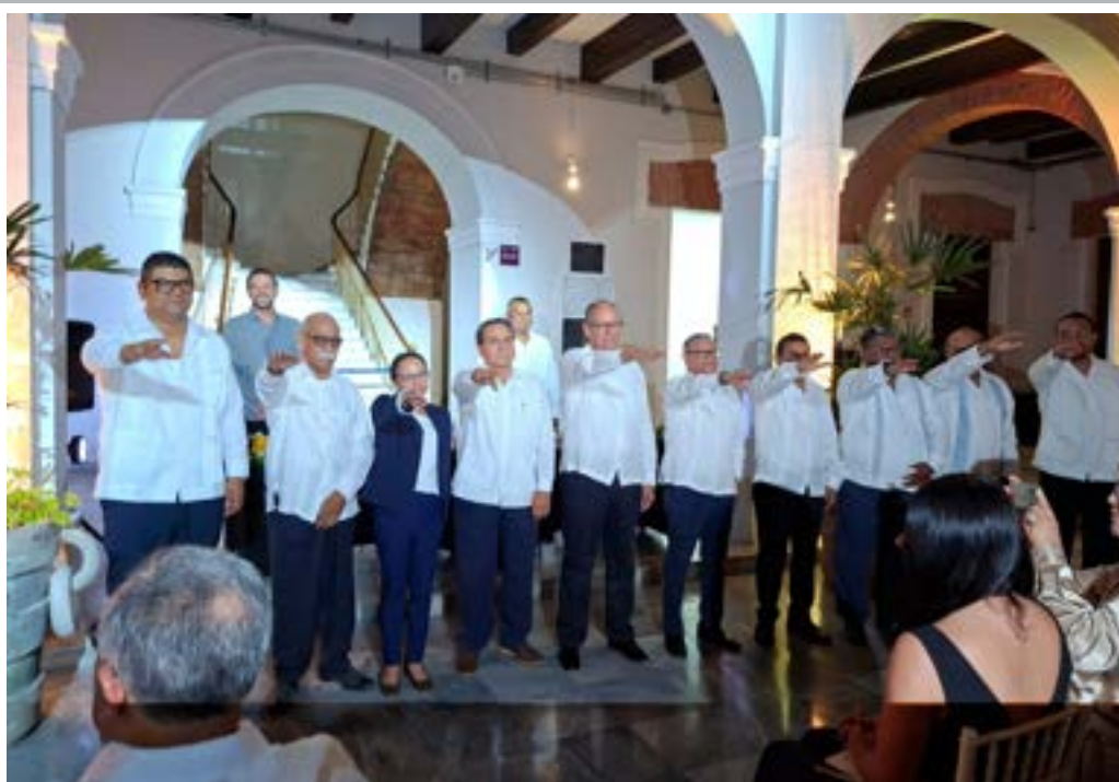
COLEGIO DE INGENIEROS CIVILES DE VERACRUZ ASUME LA RESPONSABILIDAD DE SERVIR A LA SOCIEDAD Pág. 12