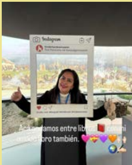
En el Tirol, histórica región alpina en el corazón de Europa.